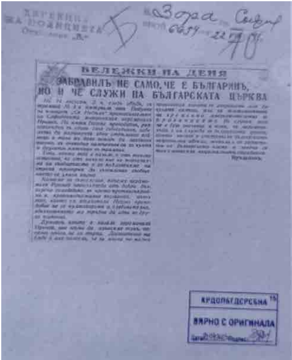
Фиг. 1 в-к „Зора“, брой 6654 от 22 VIII 1943 г.